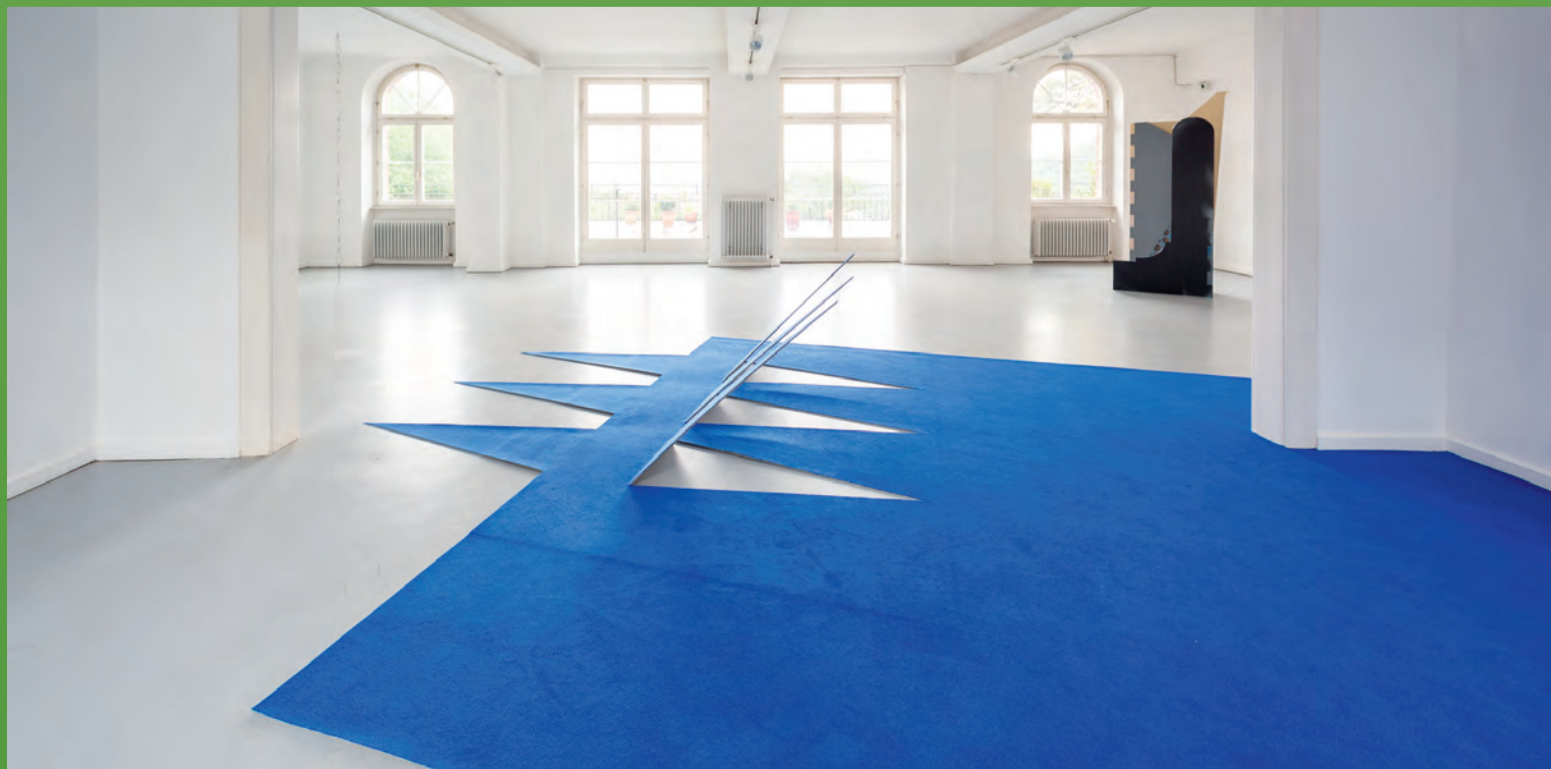
Abbildung: Nina Laaf, vom Flüstern und Formen, 2023, Foto: Lukas Giesler