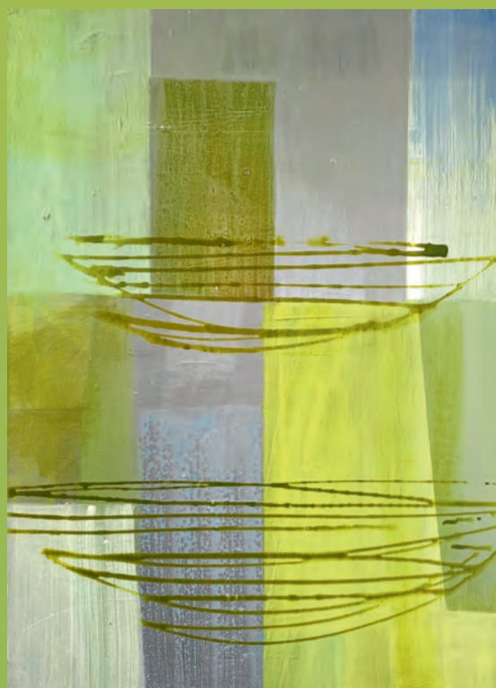
Abbildung: a. d. Reihe: Über den Gärten, 2023, 70 x 50cm