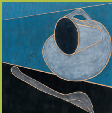
Abb.: Martina Geist, Löffel auf Blau I, 2023