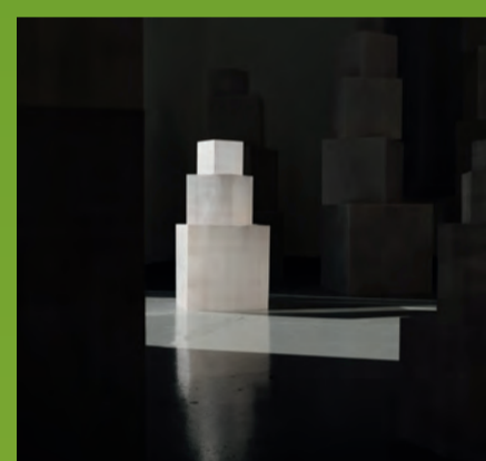
Abbildung: Peco Kawashima