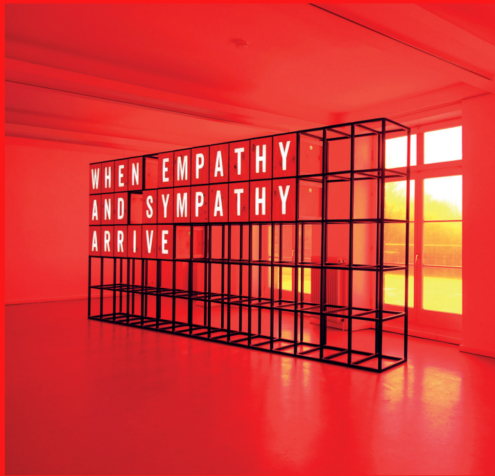
Ausstellung: Lukas Schneeweiss 2017

Der Jahresbeitrag wird mit der Beitrittserklärung fällig. Die Mitgliedschaft verlängert sich automatisch, wenn nicht bis zum Jahresende (31. November) gekündigt wird.